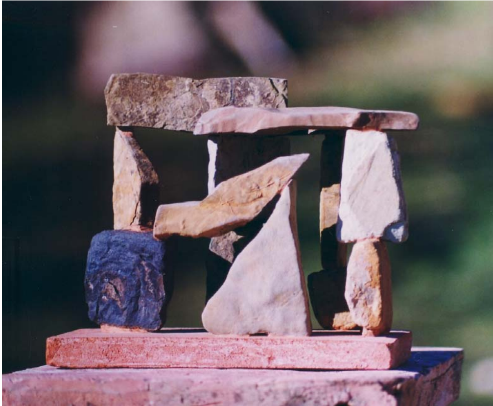
Plastik und Photo: Z.L-Kruse

LAP ŰR ERŐ REND ÉSZ 123 45 456 5678 910 Platte Leere Kraft Ordnung Geist