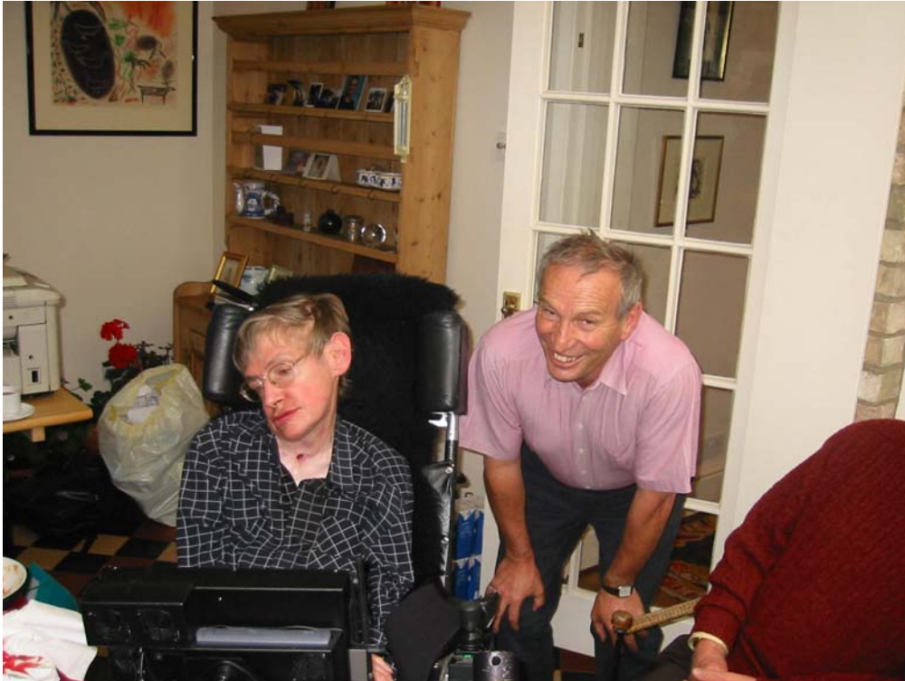
Abb. 5. Stephen Hawking zusammen mit dem Autor des Beitrags bei der Konferenz in Cambridge.