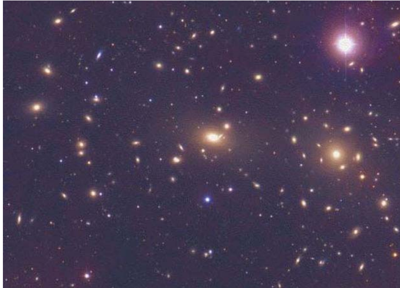
Abb. 2. Galaxien sammeln sich auf Grund der Schwerkraft zu Galaxienhaufen zusammen. Hier zu sehen der Coma-Haufen.

Nach heutiger Ansicht entstand das Universum vor 14 Milliarden Jahren in einem heißen Urknall. Das Universum war in den ersten Bruchteilen der ersten Sekunde so heiß, dass es zunächst nur aus Fundamentarteilchen bestand. Das Universum kühlte sich durch seine Ausdehnung rasch ab, so dass sich zunächst die Quarks zu den Protonen und Neutronen vereinigten. Etwa drei Minuten nach dem Urknall fusionierten dann Protonen und Neutronen hauptsächlich weiter zu Heliumkernen.