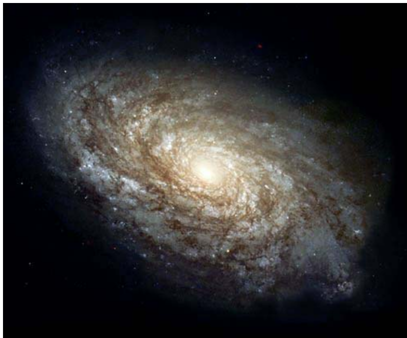
Abb. 1. Galaxien wie diese beinhalten bis zu mehreren hundert Milliarden Sterne.

Die Sterne sind im Universum nicht gleichmäßig verteilt, sondern bilden Galaxien (Abbildung 1), die durch die Schwerkraft der gesamten Materie zusammengehalten werden. Die Milchstraße, in der sich unser Sonnensystem befindet, umfasst mindestens hundert Milliarden Sterne. Galaxien bilden wieder Galaxienhaufen, in denen sich bis zu mehrere tausend Galaxien zusammenfinden können (Abbildung 2). Der Raum zwischen den Sternen ist jedoch nicht leer, sondern es befinden sich dazwischen die sogenannten interstellaren Wolken, das sind ausgedehnte Staub- und Gaswolken (Abbildung 3).