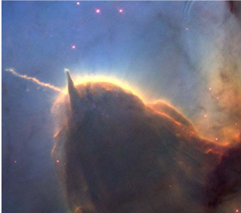
Abb. 3. Der Raum zwischen den Sternen ist nicht leer. Dort befinden sich ausgedehnte Wolken aus Staub und Gas [NASA].